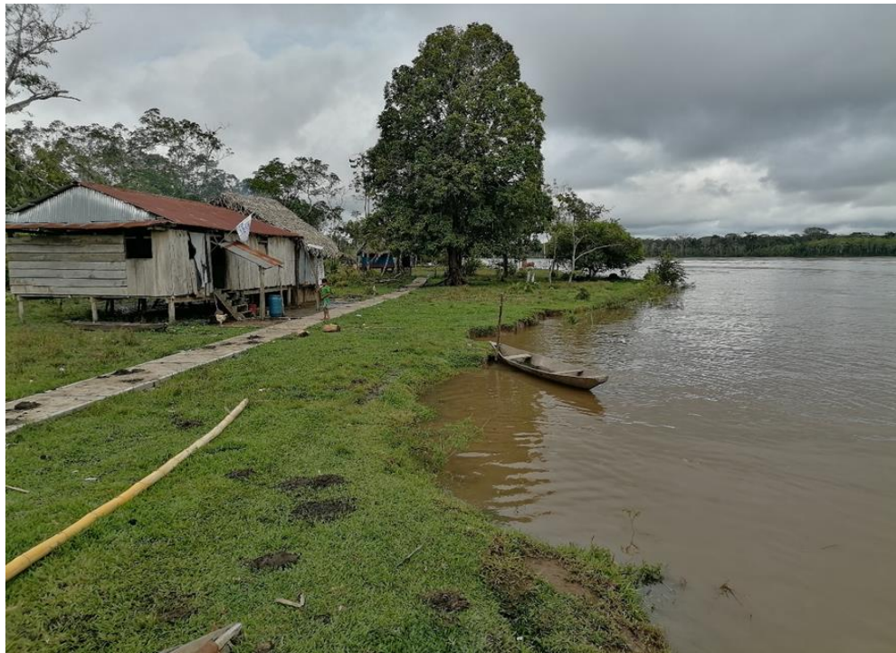
FIGURA N°02: EL TALUD DEL CAUCE DEL RÍO NAPO ESTÁ AFECTADA POR LA EROSIÓN FLUVIAL.