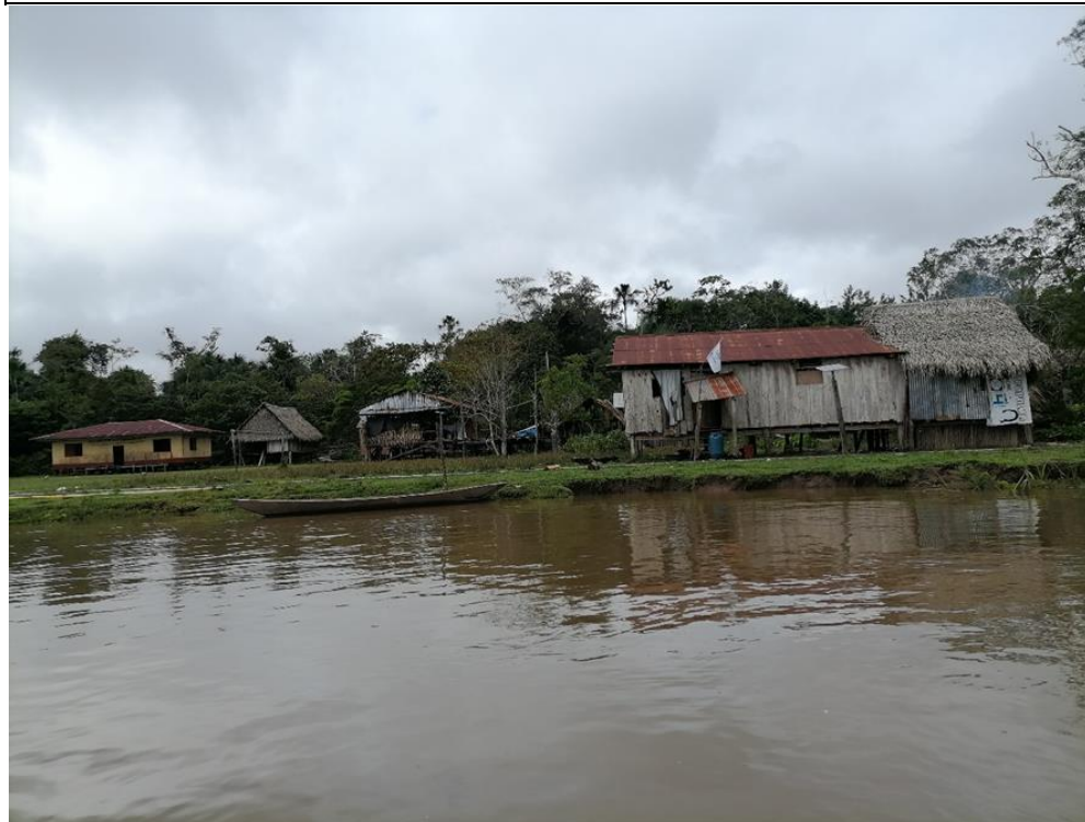
FIGURA N°01: COMUNIDAD NATIVA NUEVA ARGELIA, SE ENCUENTRA VULNERABLE A INUNDACIÓN DEL RÍO NAPO.