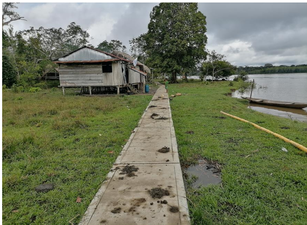
FIGURA N°03: INFRAESTRUCTURA DE SERVICIO (VEREDA PEATONAL) EN RIESGO DE DAÑO POR LA EROSIÓN FLUVIAL DEL RÍO NAPO.